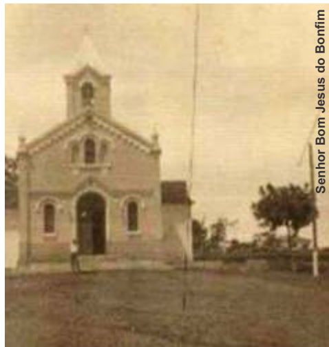
Senhor Bom Jesus do Bonfim