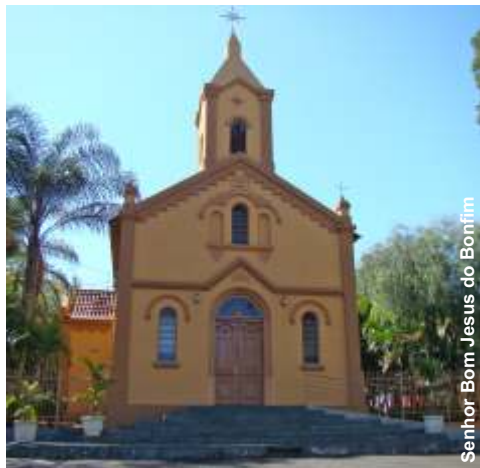
Senhor Bom Jesus do Bonfim

H á 120 anos, no dia 20 de dezembro de 1.898, criava-se a Paróquia Senhor Bom Jesus do Bonfim. Embora Distrito de Ribeirão Preto, Bonfim Paulista - enquanto Paróquia - integra não uma das foranias da cidade de Ribeirão, senão a Forania São José, que uma é das foranias do interior. E nisso, nessa pertença que foge ao razoável e se condensa no entre aspas, uma explicação se vê. Respira essa Paróquia centenária os ares da modernidade e mobilidade urbanas de que se impregna Ribeirão Preto, trazendo consigo, ao mesmo tempo, costumes só vistos na lembrança de quem um dia viveu em cidade pequena do interior, como o de se sentar à porta da