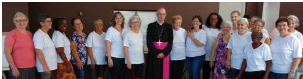
Santo Estevão Diácono/RP