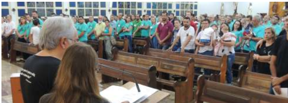
Encontro de Casais com Cristo/RP