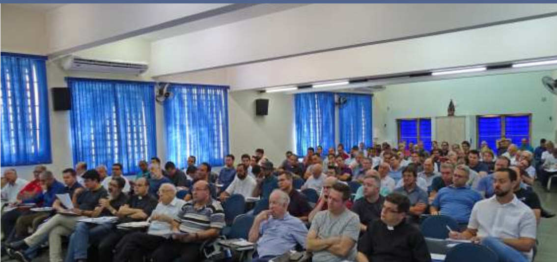
Reunião Geral do Clero - Brodowski - 29 de novembro de 2018